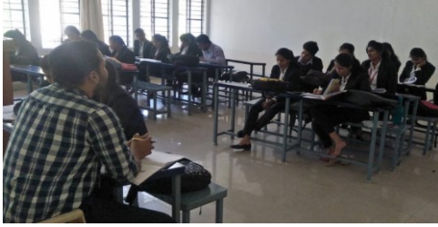
ಪ್ರಥಮ ಬಿ.ಕಾಂ ಮತ್ತು ಬಿಬಿಎ