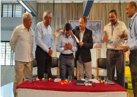
ಮುಖ್ಯ ಅತಿಥಿಗಳಿಗೆ ಗೌರವ