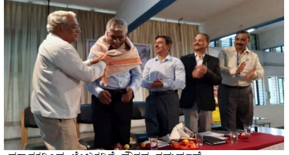
ಪ್ರಕಾಶಕರಿಂದ ಲೇಖಕರಿಗೆ ಗೌರವ ಸಮರ್ಪಣೆ