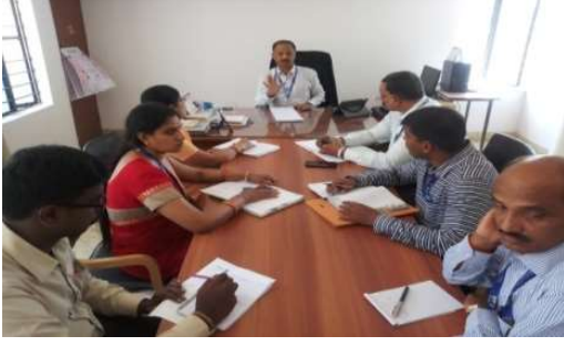
ವಾರದ ಪ್ರಗತಿ ಪರಿಶೀಲನಾ ಸಭೆಯಲ್ಲಿ ನಿರ್ದೇಶಕರು, ಪ್ರಾಂಶುಪಾಲರು ಮತ್ತು ಅಧ್ಯಾಪಕರು