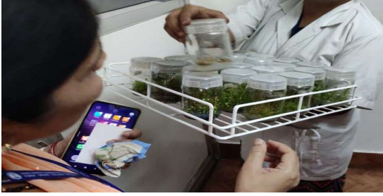
ಲ್ಯಾಬ್ ಲ್ಯಾಂಡನ ಪ್ರಯೋಗಾಲಯ