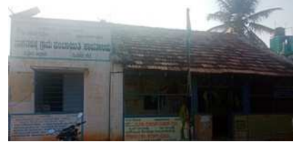
(ನಾಗನಹಳ್ಳಿಗ್ರಾಮ ಪಂಚಾಯತಿ ಕಾರ್ಯಾಲಯ)

ಕರ್ನಾಟಕ ಪಂಚಾಯತ್ ರಾಜ್ ಅಧಿನಿಯಮ 1993 ರಂತೆ ನಾಗನಹಳ್ಳಿ ಗ್ರಾಮ ಪಂಚಾಯತಿಯು 1994 ರಲ್ಲಿ ಆರಂಭವಾಗಿ ಇಂದಿಗೆ 25 ವರ್ಷಗಳನ್ನು ಪೂರೈಸಿದೆ. ನಾಗನಹಳ್ಳಿ ಗ್ರಾಮಪಂಚಾಯತಿ ವ್ಯಾಪ್ತಿಗೆ ನಾಗನಹಳ್ಳಿ ಲಕ್ಷ್ಮೀಪುರ, ಕಳಸ್ತವಾಡಿ, ಶ್ಯಾದನಹಳ್ಳಿ ಹಾಗೂ ಏಕಲವ್ಯನಗರ ಗ್ರಾಮಗಳು ಒಳಪಡುತ್ತವೆ.