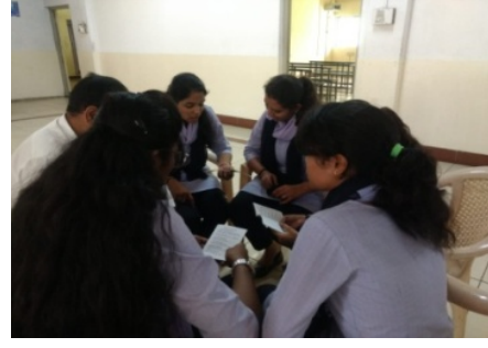
Students are discussion with the students