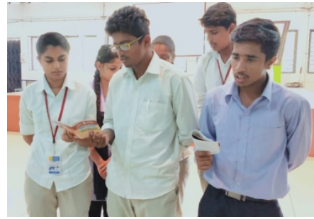
Students are singing a song